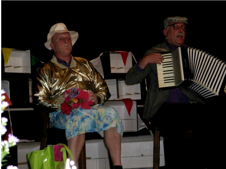
Klun en Knoffelhakke

Nu het officiële gedeelte achter de rug was konden we ons gemakkelijk in onze stoel plaatsen om onder het genot van een drankje te genieten van een voorstelling van het duo Klun en Knoffelhakke. Voor de Woudzangers geen onbekende aangezien ze vorig jaar ook al een avondvullend programma hadden neergezet. Maar zoals al gemeld was deze avond speciaal en hadden we iets te vieren. De heren hebben hun best gedaan en een speciaal 60-jarig jubileum voorstelling in elkaar gezet, exclusief voor deze avond. Enkele