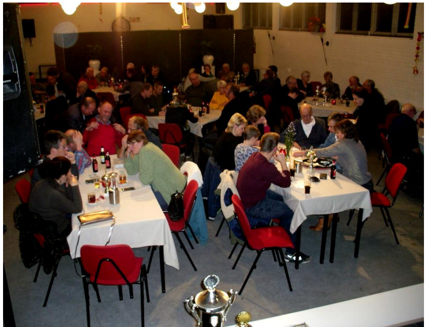
Overzicht van de zaal

Tijdens de pauze werd er weer volop gewerkt aan de loten verkoop voor de loterij later op de avond. Zoals elk jaar werd er weer flink in de buidel getast voor dat ene lot die dat begeerde vleespakket zou kunnen opleveren. Na het 2 de deel van Klun en Knoffelhakke was het dan zover, de loterij ging beginnen. De winnende loten werden voorgelezen en de prijzen werden in ontvangst genomen. En zoals altijd heeft de één wat meer geluk dan de ander. Maar aan het eind draait het toch allemaal weer om het behoud van de vereniging want daar zijn we met z’n allen trots op.