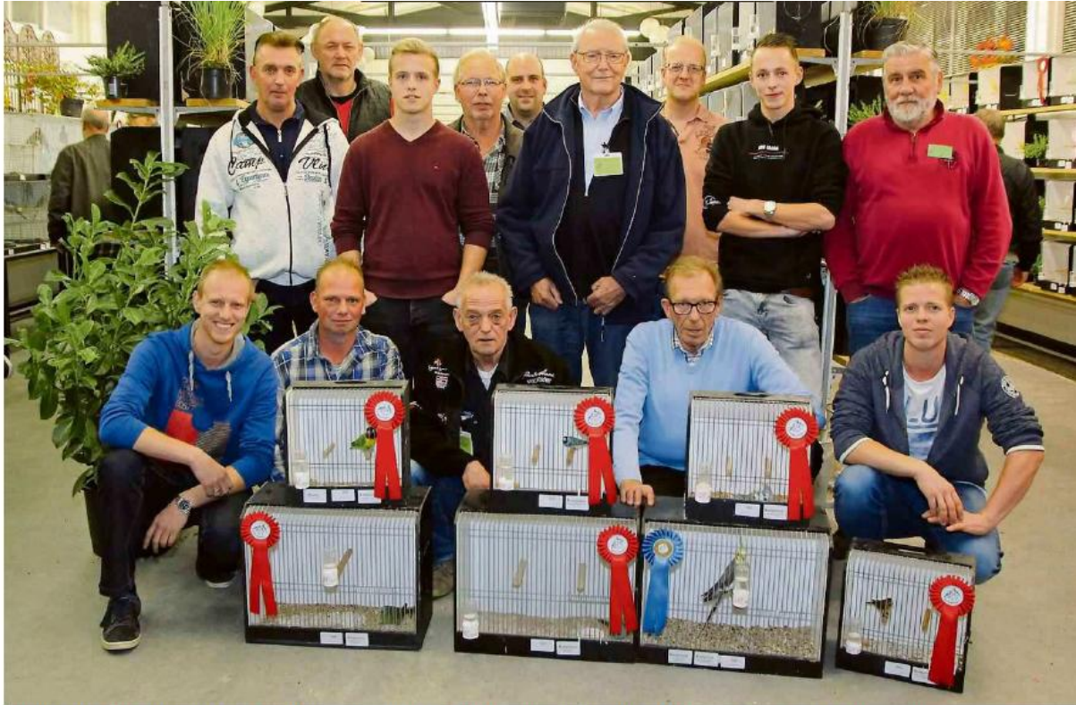
Een gedeelte van de kampioenen van vollèrvereniging De Woudzangers In De Klok In Harkema.